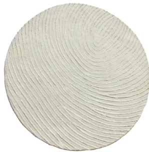
MRS 01 Bianco

I dati forniti in questa scheda tecnica sono aggiornati al momento della pubblicazione. Carpet Edition si riserva il diritto di modificare materiali, dimensioni e caratteristiche senza preavviso. The data provided in these technical specifications are up to date at the time of publication. Carpet Edition reserves the right to modify materials, sizes and characteristics without notice.